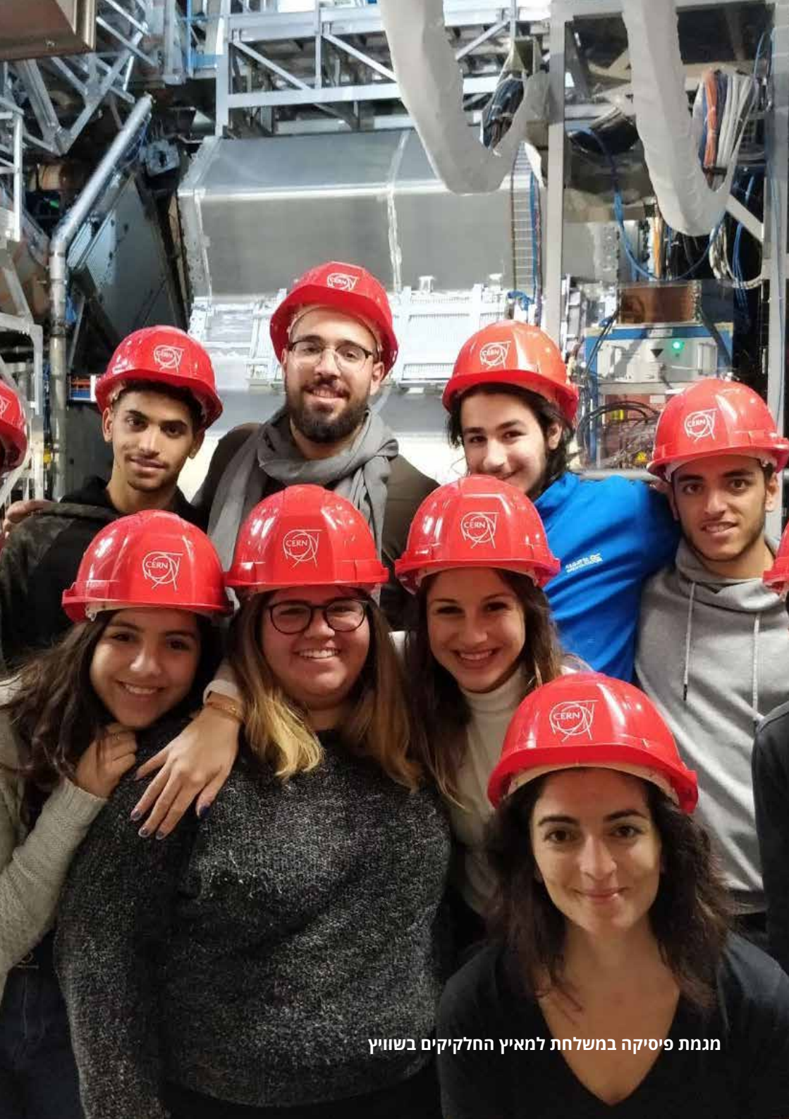
מגמת פיסיקה במשלחת לחאיץ החלקיקים בשוויץ