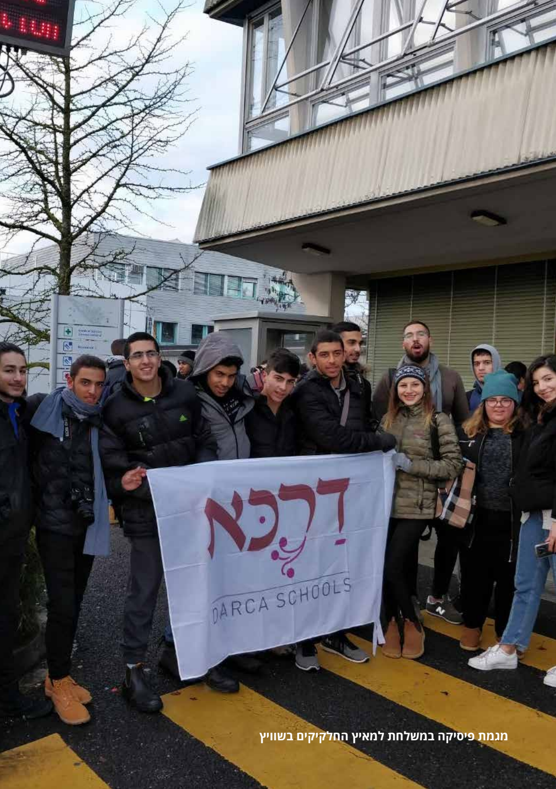
מגמת פיסיקה במשלחת לחאיץ החלקיקים בשווייץ