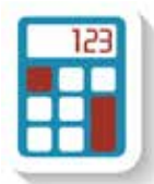
מסלול מצוינות במתמטיקה

בבית הספר רנה קסין פועלים מסלולי מצוינות בתחומים שונים. אנו מאמינים כי כל תלמיד יכול להצטיין בתחום כל שהוא ועל כן בבית הספר ישנם מסלולי מצוינות בתחומים מגוונים ביותר: