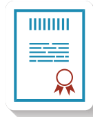
מסלול מצוינות באנגלית