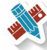
מסלול מצוינות באמנות

מסלולי המצוינות מקדמים את התלמידים לקראת הצלחה חסרת תקדים בלימודי 5 יח"ל באנגלית, במתמטיקה, ובמגמות מדעיות וטכנולוגיות הפותחות דלתות לאקדמיה. כהשלמה למסלולי המצוינות מתקיימת תכנית של שילוב תלמידים באקדמיה בשיתוף האוניברסיטה העברית.