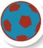
מסלול מצוינות בספורט