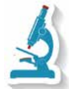
מסלול מצוינות מדע ורוח