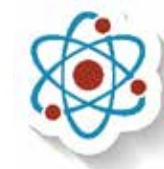
מסלול מצוינות ברובטיקה